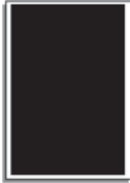
1/1 Seite 190 x 285 mm: € 1.995,- (max. 210 x 297 mm bei dreiseitigem Anschnitt )