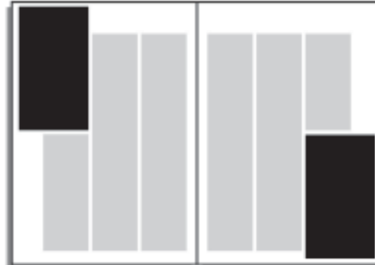
1/4 Seite Eck* 79 x 140 mm: € 498,75 (max. 87 x 145 mm bei zweiseitigem Anschnitt)

Bei Anzeigen mit Anschnitt bitte 3 mm Beschnitt berücksichtigen!