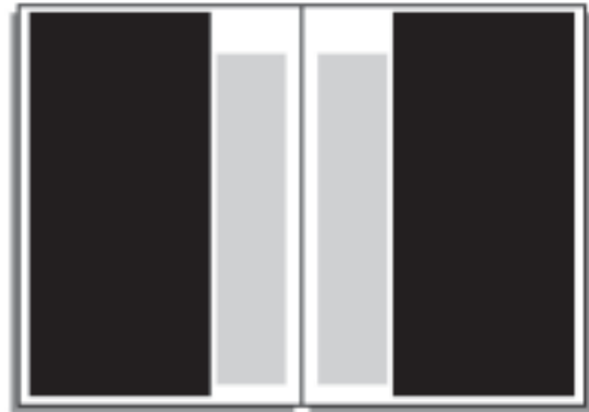
2/3-Seite 134 x 202 mm: € 1.330,- (bis max. 142 x 210 mm bei dreiseitigem Anschnitt)