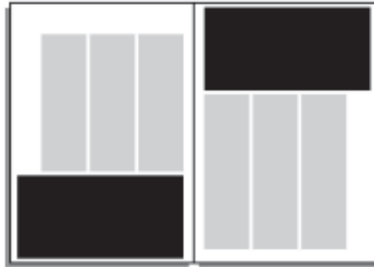
1/3 Seite quer* 190 x 95 mm: € 665,- (max 198 x 100 mm bei zweiseitigem Anschnitt)

Bei Anzeigen mit Anschnitt bitte 3 mm Beschnitt berücksichtigen!