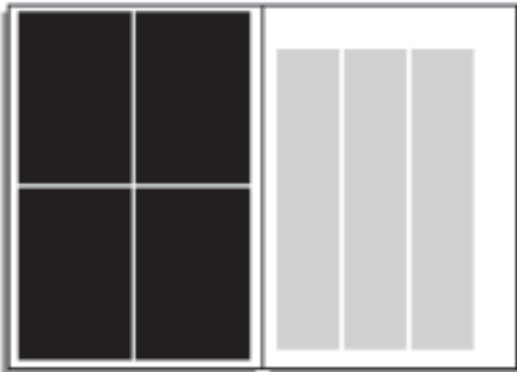
1/4 Seite AT (links oder rechts oben, links oder rechts unten) 94 x 142 mm: € 498,75