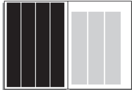
1/4 Seite AT Streifenanzeige 45 x 260 mm: € 455,-