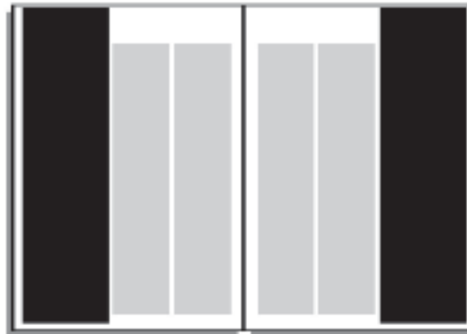
1/3 Seite außen 60 x 260 mm: € 665,- (max. 70 x 280 mm bei dreiseitigem Anschnitt)

Bei Anzeigen mit Anschnitt bitte 3 mm Beschnitt berücksichtigen!