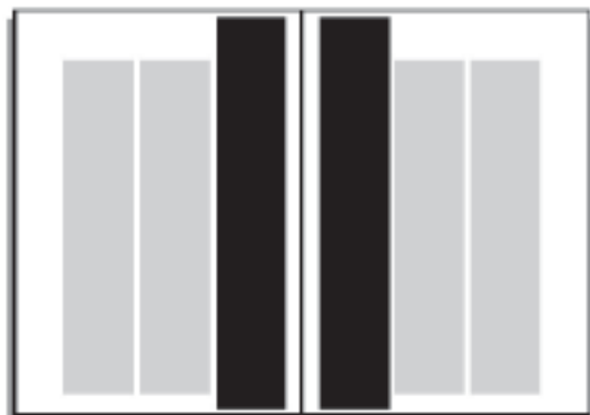
1/3 Seite innen 63 x 260 mm: € 665,- (max. 73 x 280 mm bei dreiseitigem Anschnitt)

Bei Anzeigen mit Anschnitt bitte 3 mm Beschnitt berücksichtigen!