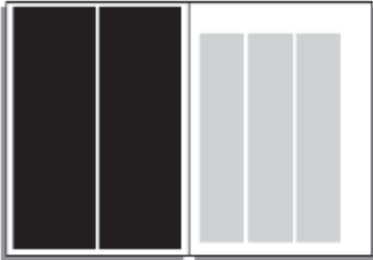
1/2 Seite hoch AT (links oder rechts) 90 x 260 mm: € 910,-